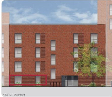
Haus 1.2 | Ostansicht