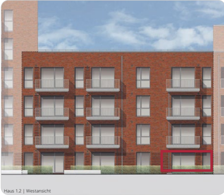
Haus 1.2 | Westansicht