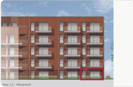
Haus 1.3 | Westansicht