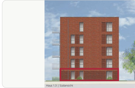
Haus 1.3 | Südansicht