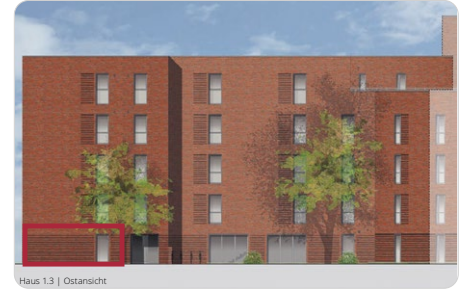
Haus 1.3 | Ostansicht